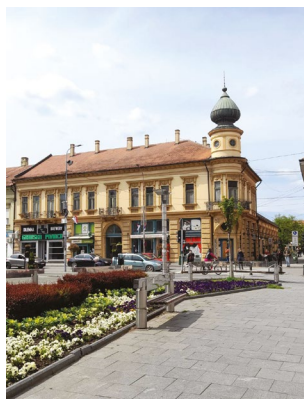
Слика 4 – Закова кућа