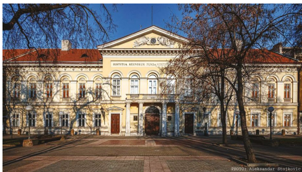
Слика 10 – Народни музеј Панчево, место гдесу некада одржаване седнице Градског поглаварства