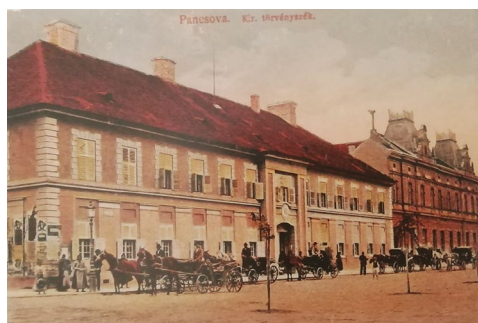
Слика 8 – Зграда Окружног суда у Панчеву некада