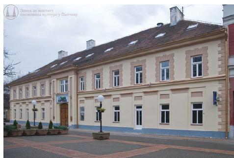
Слика 9 – Зграда Окружног суда у Панчеву данас

тима за сваки излазак пред суд плаћало 500 динара и више. 72 Остатак цене се формирао по томе да ли су адвокати извршили посао за који су били задужени, и по томе су добијали остатак зараде. Када се наводи посао у целокупном смислу, узмали су процентуално од 15% и више за сваку добијену парницу, али као што је већ напоменуто имали су могућност да сами формирају цену својих услуга. 73 Подаци о заради адвоката би били још прецизнији да су је сами адвокати више помињали, остављали доказе о исплати по завршетку парнице итд. Мада, узимајући у обзир цене основних животних намирница у том периоду и то да су поједини адвокати месечно издвајали око 600 динара за изнајмљивање канцеларије или стамбеног простора... 74 Можемо рећи да су водили солидан начин живота, и да су неки од њих били чак и имућнији грађани Панчева. Наравно да то, као и данас, зависи од случаја до случаја и начина њиховог развоја у оквиру професије.